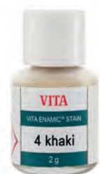
Charakteryzacja farbkami VITA ENAMIC Stains