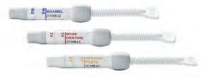
Indywidualizacja przy pomocy VITA VM LC