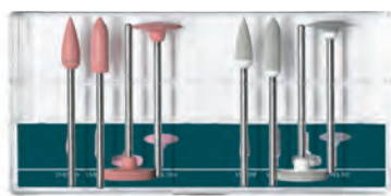
VITA ENAMIC Narzędzia polerskie